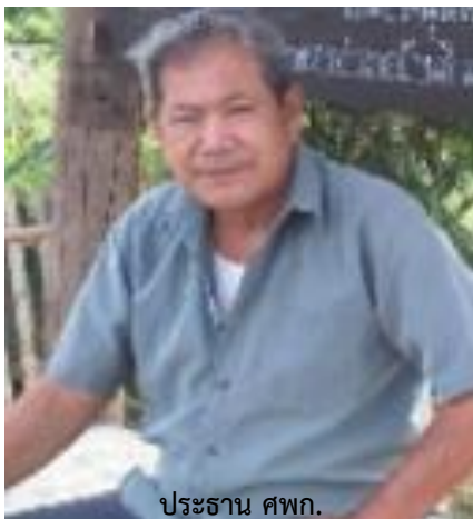
ประธาน ศพก.

แผนที่ตั้งศูนย์เรียนรู้ : ให้แสดงแผนที่ตั้งพอสังเขป